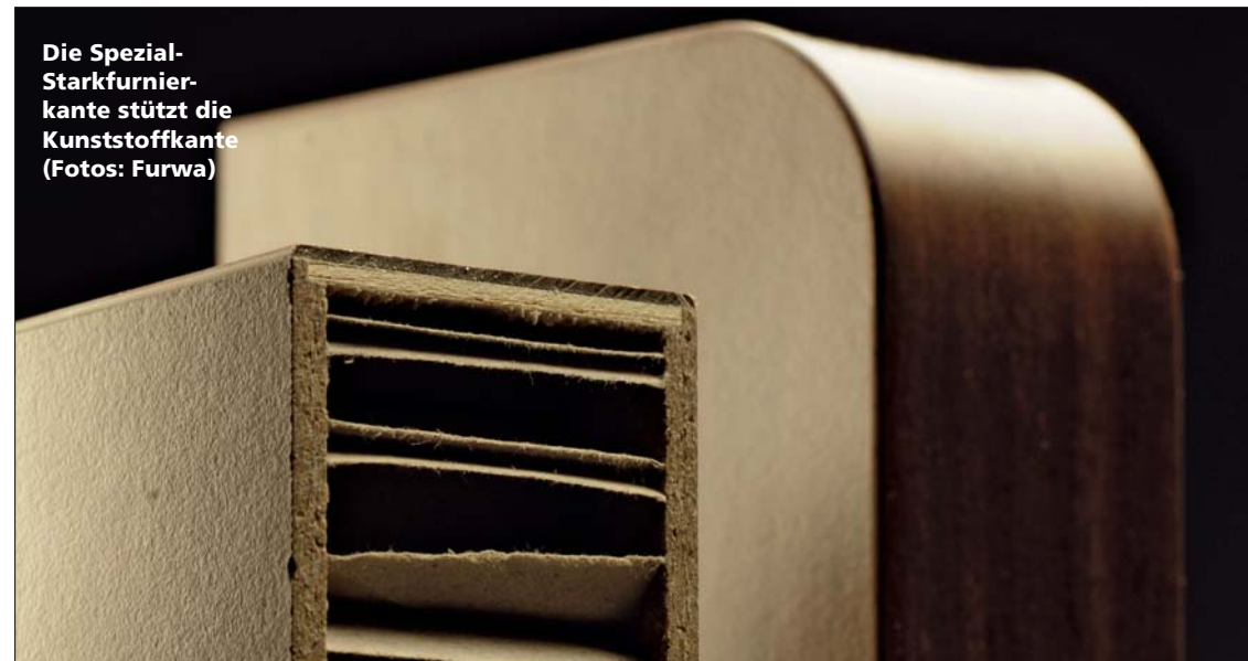
Die Spezial-Starkfurnierkante stützt die Kunststoffkante

Der Autor ist Geschäftsführer der Furwa Furnierkanten GmbH in Walkertshofen.